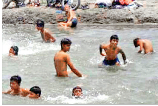
यमुनानगर में रविवार को मौसम में गर्मी की तपिश से बचने के लिए पश्चिमी नहर में नहाते हुए लोग।

जबकि दुकानों व प्रतिष्ठानों में एसी और कूलर चलने से बिजली की खपत बढ़ने लगी है। वहीं, रविवार को गर्मी की तपिश बढ़ने से जिले का अधिकतम तापमान बढ़कर 39 डिग्री पहुंच गया।