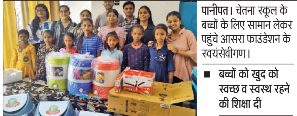
पानीपत। चेतना स्कूल के बच्चों के लिए सामान लेकर पहुंचे आसरा फाउंडेशन के सदस्यसंगीगण।

आसरा फाउंडेशन नौवीं से बारवी कक्षा में पढ़ने वाले बच्चों द्वारा चलाया गया फाउंडेशन है जिसको हाल ही में समाजसेवा करते हुए एक साल पूरा हो गया। जिसकी खुशी मनाते हुए आसरा फाउंडेशन ने एक प्रोजेक्ट किया। जिसमें ज्योति कालोनी स्थित दो चेतना स्कूल के 135 बच्चों को आसरा टीम ने हाइजीन किट्स। जिनमें रोजमर्रा में